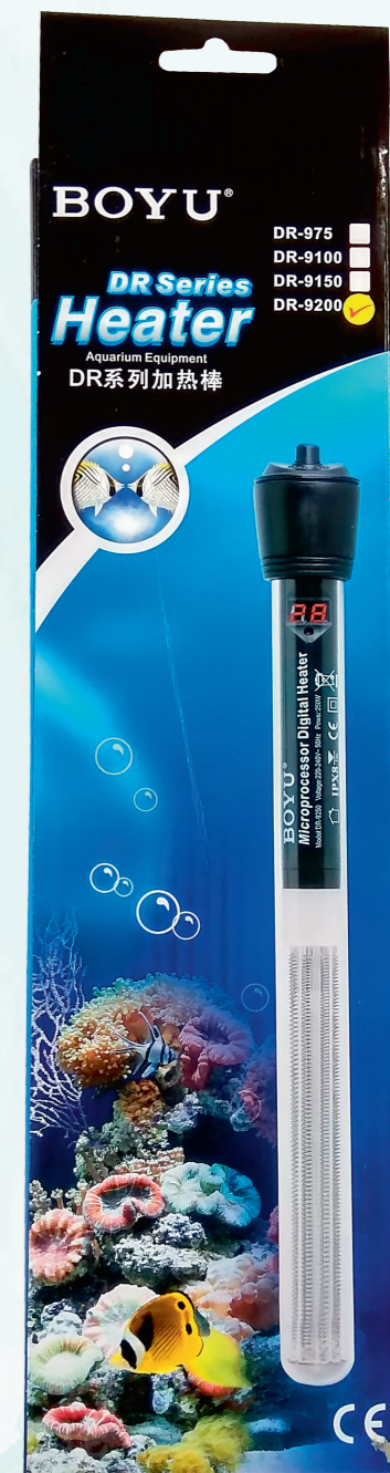
Яркая информативная розничная упаковка