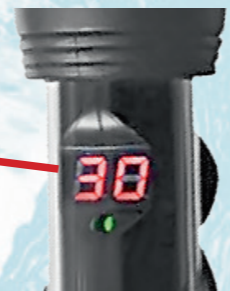
Цифровой LED-индикатор установленной температуры