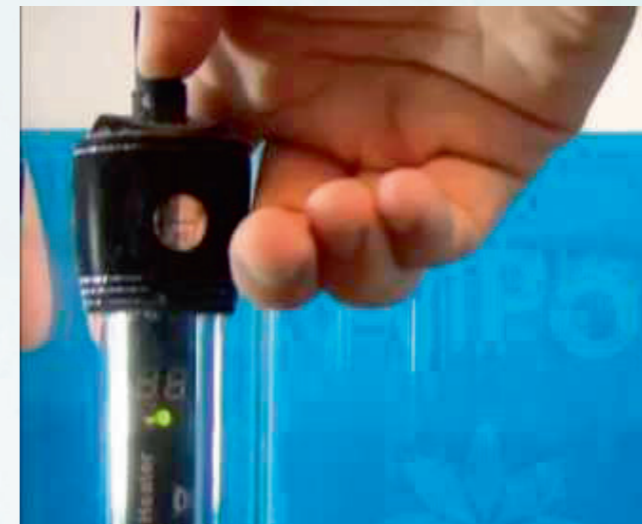
Значение температуры задаётся нажатием кнопки