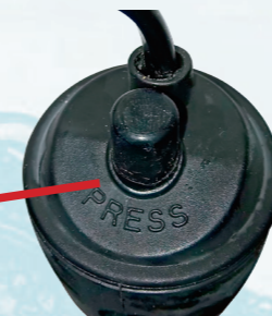
Герметично защищённая кнопка установки температуры