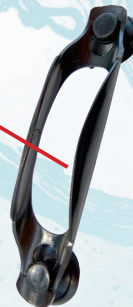
Надёжное крепление на долговечных присосках