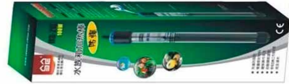
Эстетичная и информативная розничная упаковка