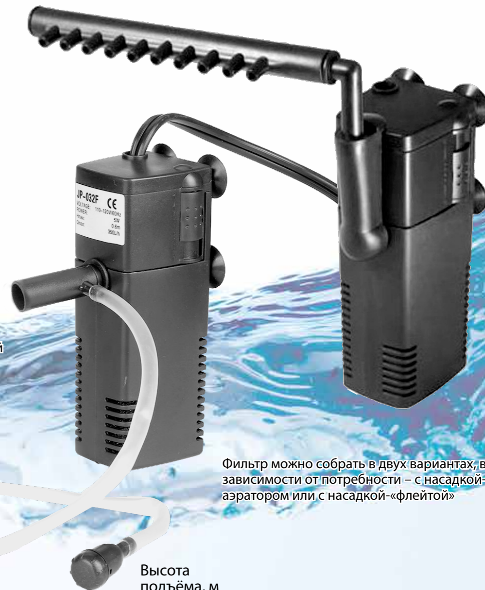
Фильтр можно собрать в двух вариантах, в зависимости от потребности – с насадкой-аэратором или с насадкой-«флейтой»