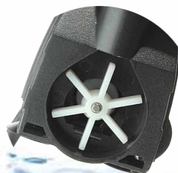
Прочный ротор с валом из нержавеющей стали, не подверженной коррозии.