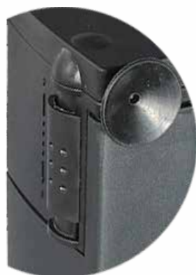
Удобный плавный регулятор потока