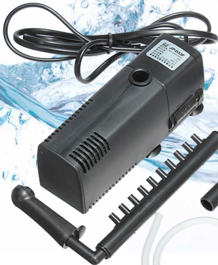
Насадка-«флейта» с отводами, регулируемая по высоте

КОМПАКТНЫЕ РЕГУЛИРУЕМЫЕ ВНУТРЕННИЕ ФИЛЬТРЫ