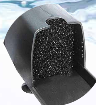
Большая среднепористая губка занимает весь внутренний объём фильтра, обеспечивая эффективную очистку воды