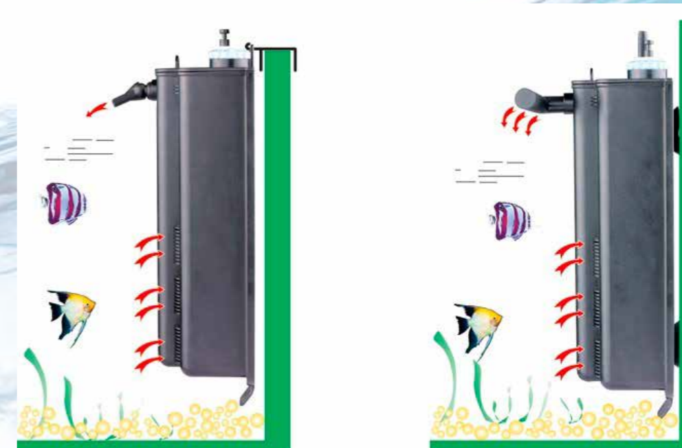
Варианты сборки и крепления. СЛЕВА – выходной патрубок с соплом; крепление на двух клипсах. СПРАВА – выходной патрубок с «флейтой»; крепление на четырёх присосках.