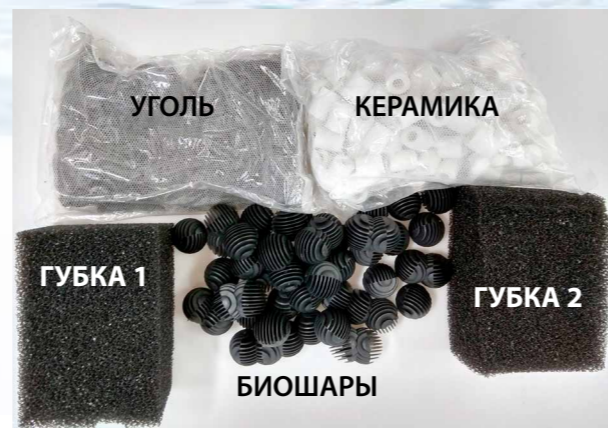
Все наполнители входят в комплектацию