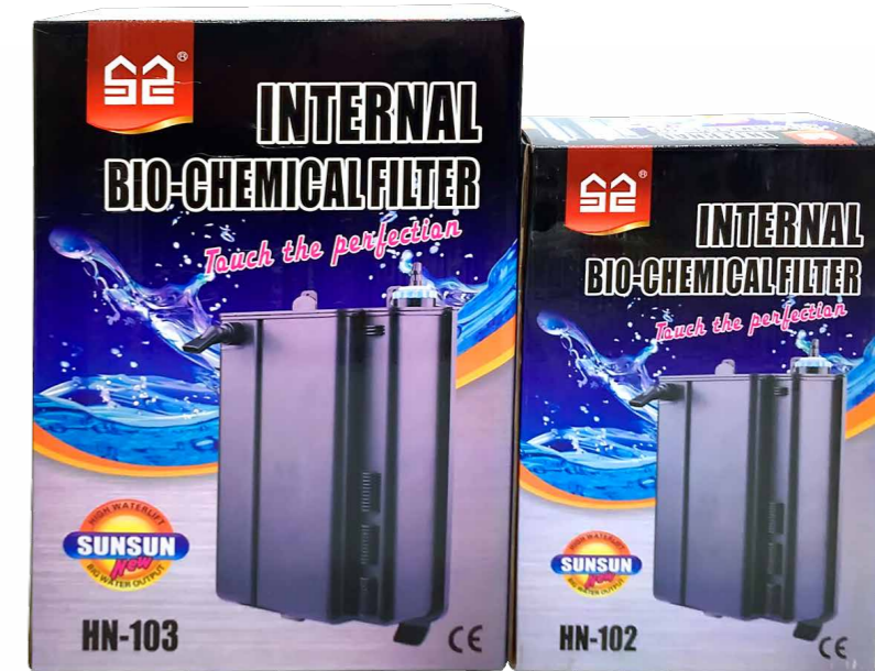
Примеры розничной упаковки