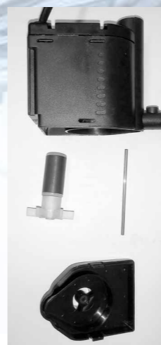
Съёмная помпа с осью из нержавеющей стали